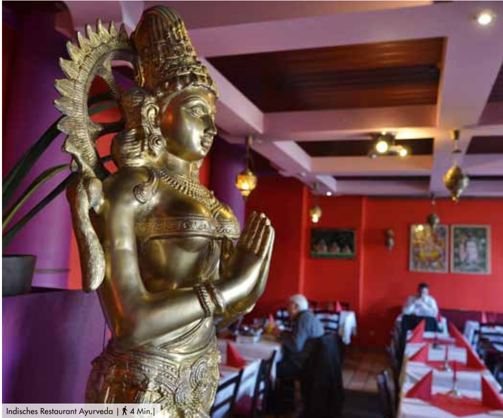
Indisches Restaurant Ayurveda | 🚶 4 Min. |