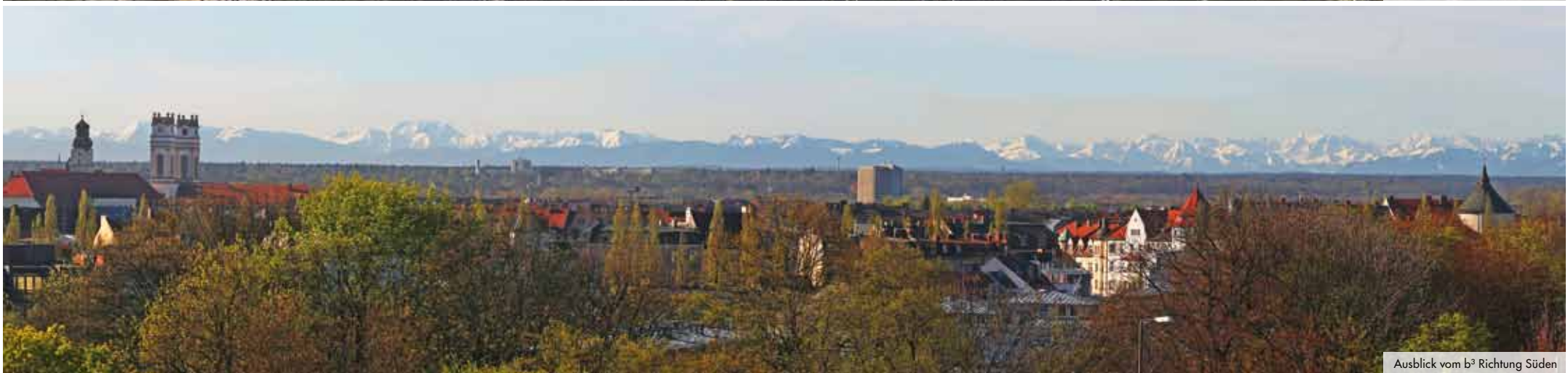
Ausblick vom b 3 Richtung Süden