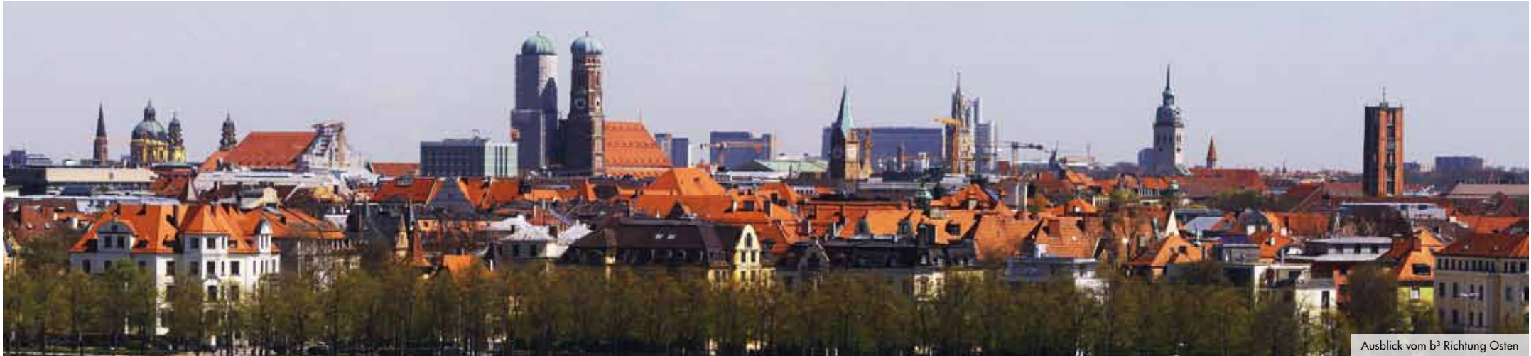
Ausblick vom b 3 Richtung Osten