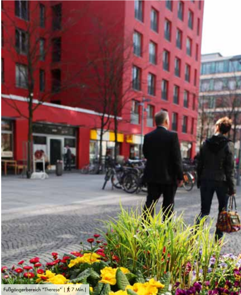
Fußgängerbereich "Therese" | 7 Min. |