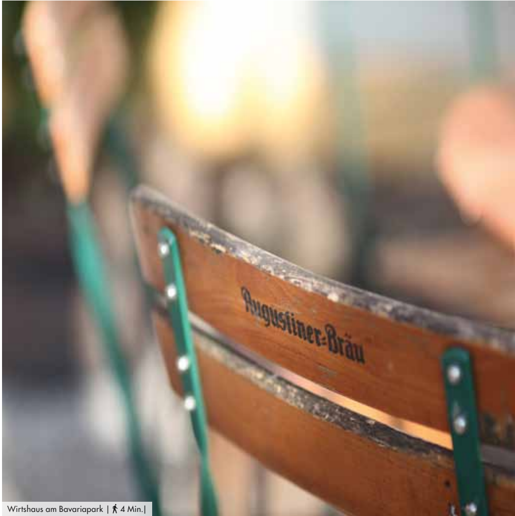
Wirtshaus am Bavariapark | 🚶 4 Min. |