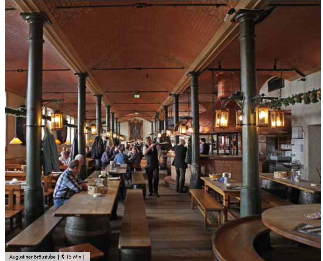
Augustiner Bräustube | 🚶 15 Min. |